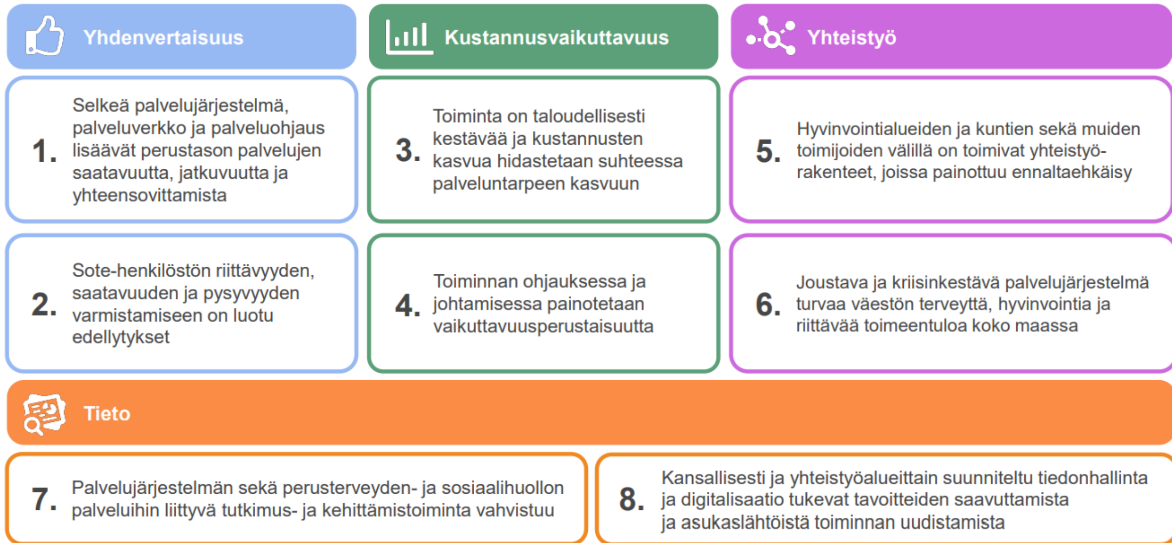
Kuvio 1. Valtakunnalliset tavoitteet sosiaali- ja terveydenhuollon järjestämiselle